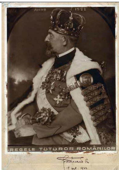
Ferdinand I, Regele Tuturor Românilor,