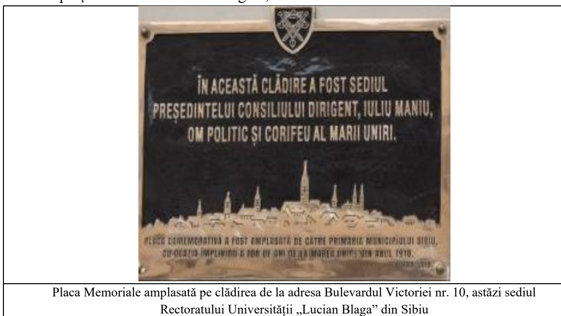
Placa Memoriele amplasată pe clădirea de la adresa Bulevardul Victoriei nr. 10, astăzi sediul Rectoratului Universității „Lucian Blaga” din Sibiu