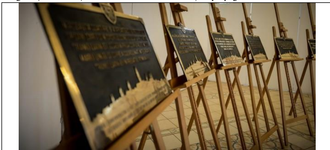
Plăcile memoriale care au fost amplasate în 2018, cu ocazia sărbătorii centenarului Marii Uniri, pe cele 17 imobile din Sibiu cu însemnătate în istoria Marii Uniri

În clădirea Colegiului Național „Gheorghe Lazăr” din Sibiu a funcționat Resortul Armatei și al Siguranței Publice și Resortul Afacerilor Externe și al propagandei ziaristice.