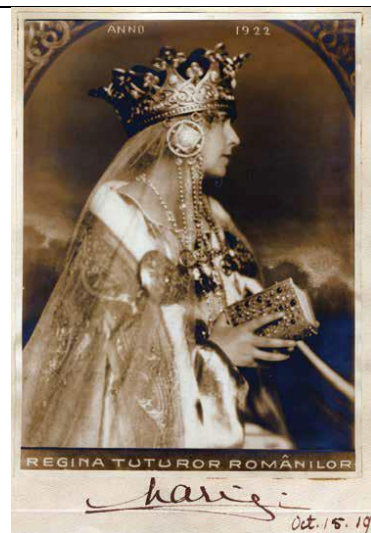
Maria, Regina Tuturor Românilor