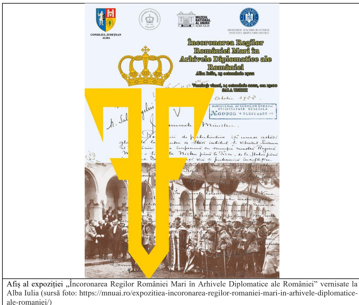
Afiș al expoziției „Încoronarea Regilor României Mari în Arhivele Diplomatice ale României” vernisate la Alba Iulia

Alba Iulia. O altă instituție care a celebrat evenimentul Încoronării regilor Ferdinand și Maria în catedrala ortodoxă de la Alba Iulia, din 15 octombrie 1922, a fost Muzeul Național al Unirii de la Alba Iulia prin expoziția intitulată „Încoronarea Regilor României Mari în Arhivele Diplomatice ale României”. Aceasta prezintă și ilustrează documente, ziare din presa internațională, emisiuni filatelice, medaliile ale Încoronării prin care a reușit să surprindă rolul și prezența a unor oaspeți „de poveste”, care s-au aflat atunci, alături de familia regală a României la momentul solemn al încoronării în orașul Alba Iulia. Este vorba de participanți, reprezentanți ai familiilor regale europene (de ex. reprezentanți din familia regală britanică sau familia imperială japoneza), membri ai misiunilor străine, diplomați de carieră, mareașali, etc..